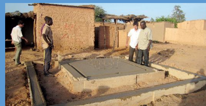
Construction de borne-fontaine en zone non lotie